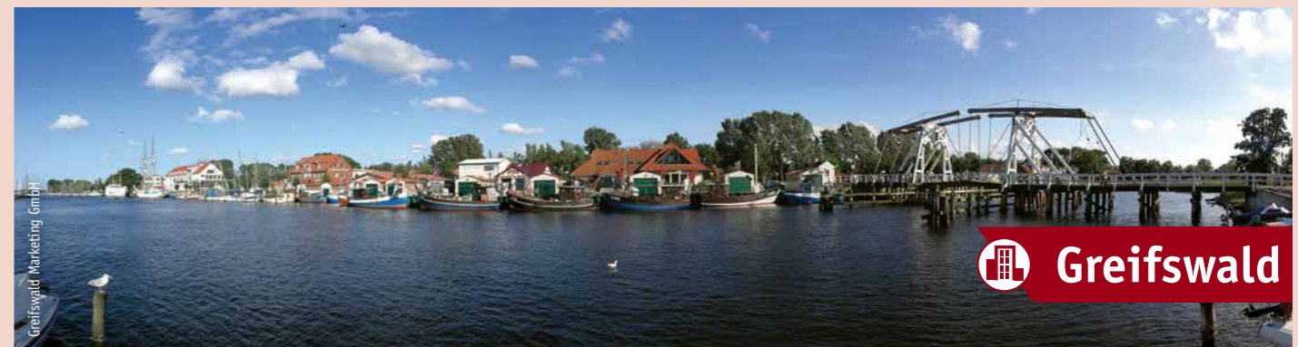
Greifswald Marketing GmbH